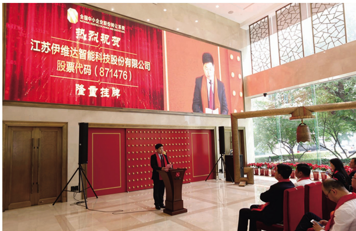
▲2017 年公司新三板挂牌仪式

样系统、新疆乌苏供热工程的煤炭采样、机器人制样、自动压片、激光快速检测(LIBS)系统,亦为国内首创。2021年,公司成功签订广西金川汽车运输铜精粉机器人采制样系统,鞍钢鲅鱼圈汽车运输吨袋机器人视觉识别采制样系统,这两套系统均为国内外首创。今年公司又以先进的工艺流程、创新的解决方案成功中标宝武集团新余钢铁烧结矿机器人采制样系统、北矿检测机器人制样单元等工程项目。