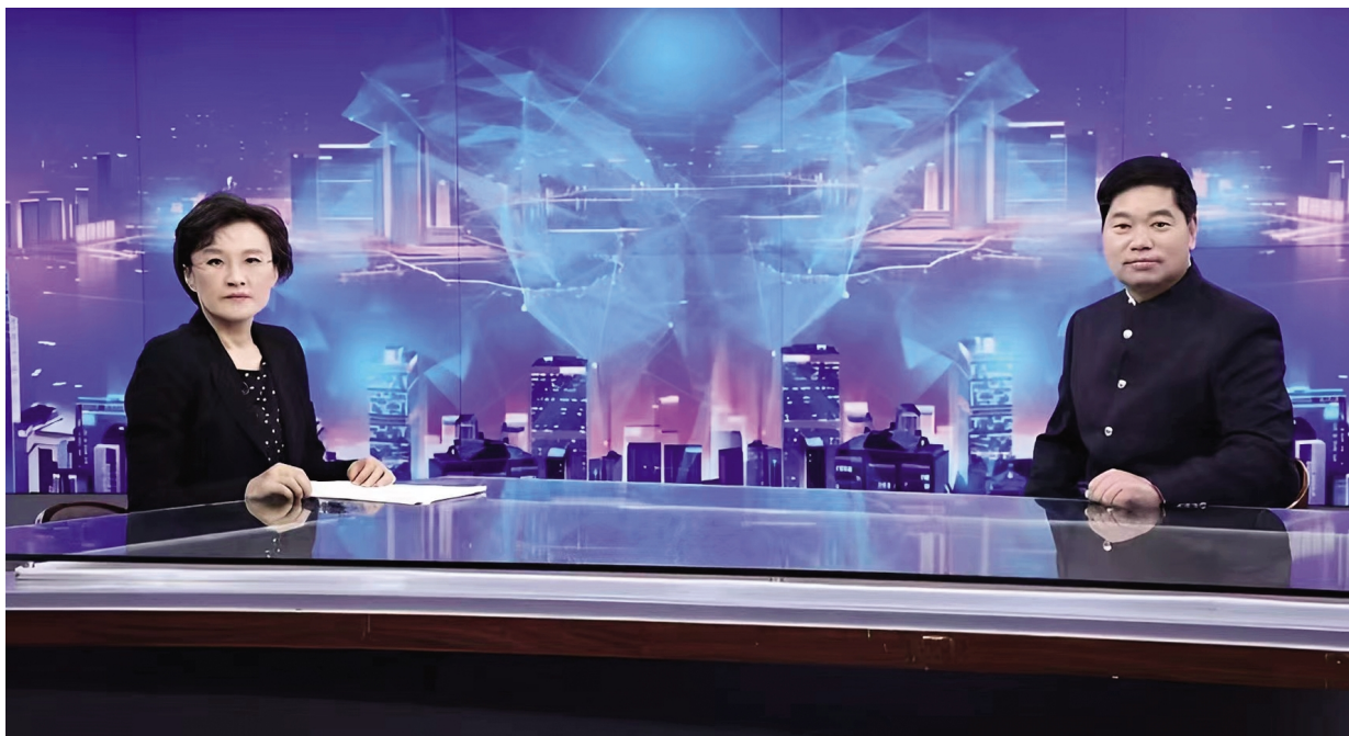
▲王晓强董事长做客 CCTV——《信用中国》栏目

2006年,他创立了徐州伊维达技术有限公司,当年即成功中标神华集团天津港三套两米带宽装船商检自动化采制样系统工程,这一举打破了宽皮带、高带速及大流量领域的采制样系统被美国和德国等国外企业垄断的局面,大大节约了建设成本。2008年,公司成功中标南通港进口铁矿石商检自动化采制样系统工程,率先实现了进